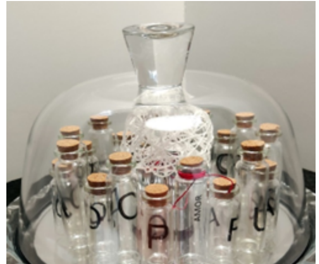
Imagen 10: instalación Moradas de la luz dormida , de la serie Luz dormida . Instalación poética basada en el último libro de poesía de la artista: Luz dormida (Lastura, 2023).

Una bola luminosa, de 20 cm de diámetro, cubierta por una tira de papel impreso (200 metros, con el poemario íntegro). La instalación va colocada sobre un espejo de 30x60 cm,