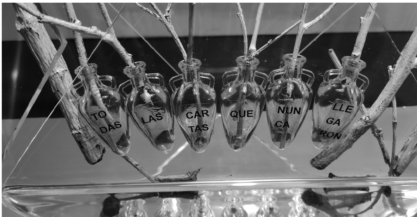
Imagen 1:- detalle de la instalación TODAS LAS CARTAS QUE NUNCA LLEGARON . Homenaje a las personas que esperaban una carta que no recibieron. Algunas se perdieron, otras se incautaron, muchas no llegaron nunca por muy diversas razones.

Diseño y maquetación: Nieves Álvarez. © de las autoras. Publicacion no venal. 2023.