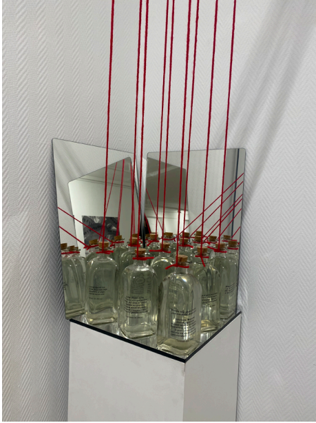
Imagen 8: instalación Sublimación del amor , de la serie Palabras de Teresa .

Es una adaptación de la espiral compuesta por 500 botellas que creó la artista en el año 2015, como homenaje al 500 aniversario del nacimiento de Teresa de Jesús.