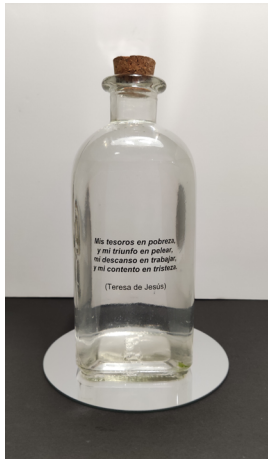
Imagen 2.- Pieza de la instalación Sublimación del amor . Frasca con versos de Teresa de Jesús.

Nadie pone en duda que Teresa es una mujer impresionante y una poeta enorme. Sus aportaciones a la lírica son significativas. Las paradojas incluidas en sus textos siguen siendo de rabiosa actualidad más de 500 años después. Su destreza y magia para este tipo de antítesis es memorable. Su sabiduría al unir dos ideas que parecen imposibles de unir es proverbial. Para confirmarlo basta con recordar dos ejemplos: vivo sin vivir en mí , o bien muelo porque no muelo .